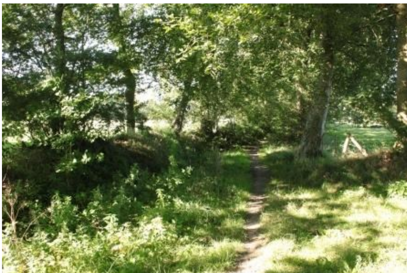
Houtwal in Noardlike Fryske Wâlden ( http://www.noardlikefryskewalden.nl/over-nfw/ )

Beschadiging van het wallichaam door vertrapping of aanvreten van de vegetatie door vee moet worden voorkomen door het plaatsen van een raster. Als er geen vee loopt, is een raster niet nodig.