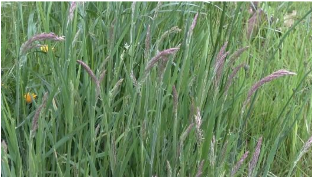
Witbol domineert hier de vegetatie, terugdringen door tweede helft mei te maaien

Dit pakket is bedoeld voor percelen waar je (extensief) kruidenrijk grasland wilt ontwikkelen, maar die nu nog zeer soortenarm zijn. Deze percelen worden bijvoorbeeld gedomineerd door witbol of bestaan nog geheel uit Engels raaigras. Verschralen van de bodem bevordert de kruidenrijkdom, dat wil zeggen dat er niet wordt bemest, er geen bagger wordt opgebracht en het maaisel wordt afgevoerd. Ook door beweiding achterwege te laten, voorkom je bemesting van het perceel en zorg je voor een snellere verschraling van het perceel. Vroeg maaien is van belang om het dominantiestadium van witbol te doorbreken, dan wel om zoveel mogelijk voedingsstoffen af te voeren. Omdat de eerste snede in het broedseizoen is, zal er naar nesten gezocht moeten worden.