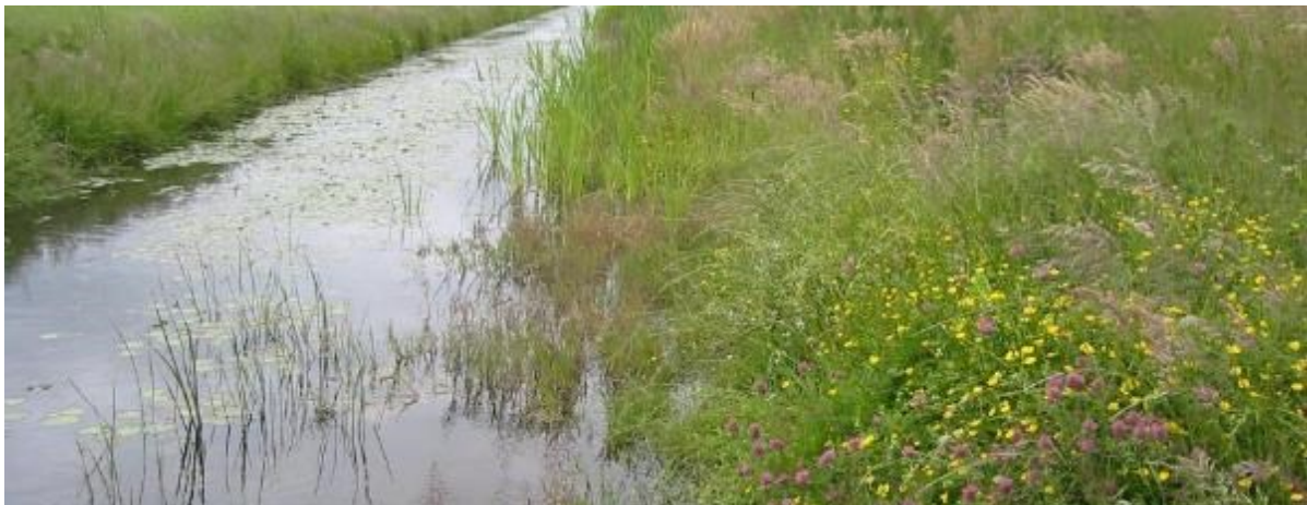
Natuurvriendelijke oever

Natuurvriendelijke oevers beschermen tegen afkalven van de oever. Door, bijvoorbeeld, drinkbakken te plaatsen, voorkom je vertrapping van de oever door vee. Dat helpt om te voorkomen dat veen 'weglekt' naar de sloot en wordt extra slibvorming voorkomen. Slib in veensloten is een belangrijke bron van methaanuitstoot. Natuurvriendelijke oevers dragen daardoor bij aan klimaatmitigatie omdat slibvorming en daarmee methaanuitstoot voorkomen wordt.