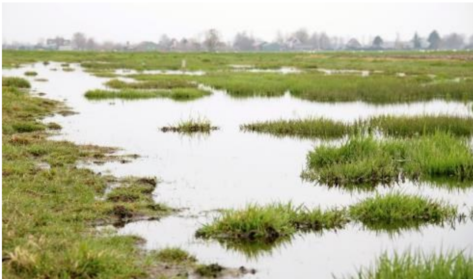
Plas dras in Krimpenerwaard

Het pakket met startdatum 15 februari heeft als voordeel dat de plasdras aanwezig is bij de start van het weidevogelseizoen, het pakket met startdatum 1 maart biedt een langere tijd voor de ontwikkeling van de bodemfauna. De plasdrassen in de periode mei-augustus hebben een functie als opvethabitat voor de vogels. De plasdras in november-december is bedoeld voor overwinterende soorten zoals de Kleine zwaan.