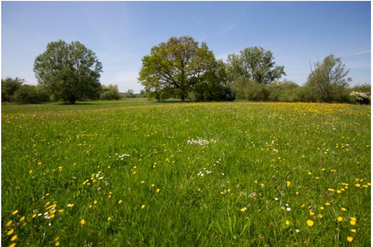
Botanisch grasland

Doelsoorten van de leefgebieden droge dooradering en open grasland waarvoor botanisch grasland meerwaarde heeft, onder andere: graspieper, patrijs, veldleeuwerik. Ook de kwartelkoning maakt gebruik van deze graslanden. Deze vogel broedt van ca. mei tot augustus, daarom is een rustperiode vanaf medio juni tot later in de zomer gewenst, dit kan via de pakketvarianten met rustperiode.