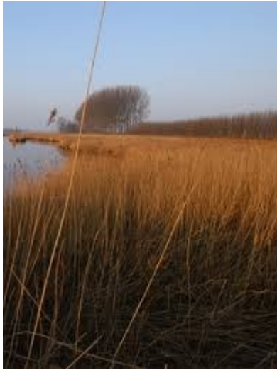
Rietzoom (Poldernatuur Zeeland)

Rietzomen zijn landschapselementen die bestaan uit smalle rietstroken die grenzen aan agrarisch gebruikte percelen. Vanwege een extensief gebruik zijn ze een belangrijk broedgebied voor rietvogels en daarnaast zijn ze van belang voor amfibieën, de ringslang, libellen en moerasvegetaties.