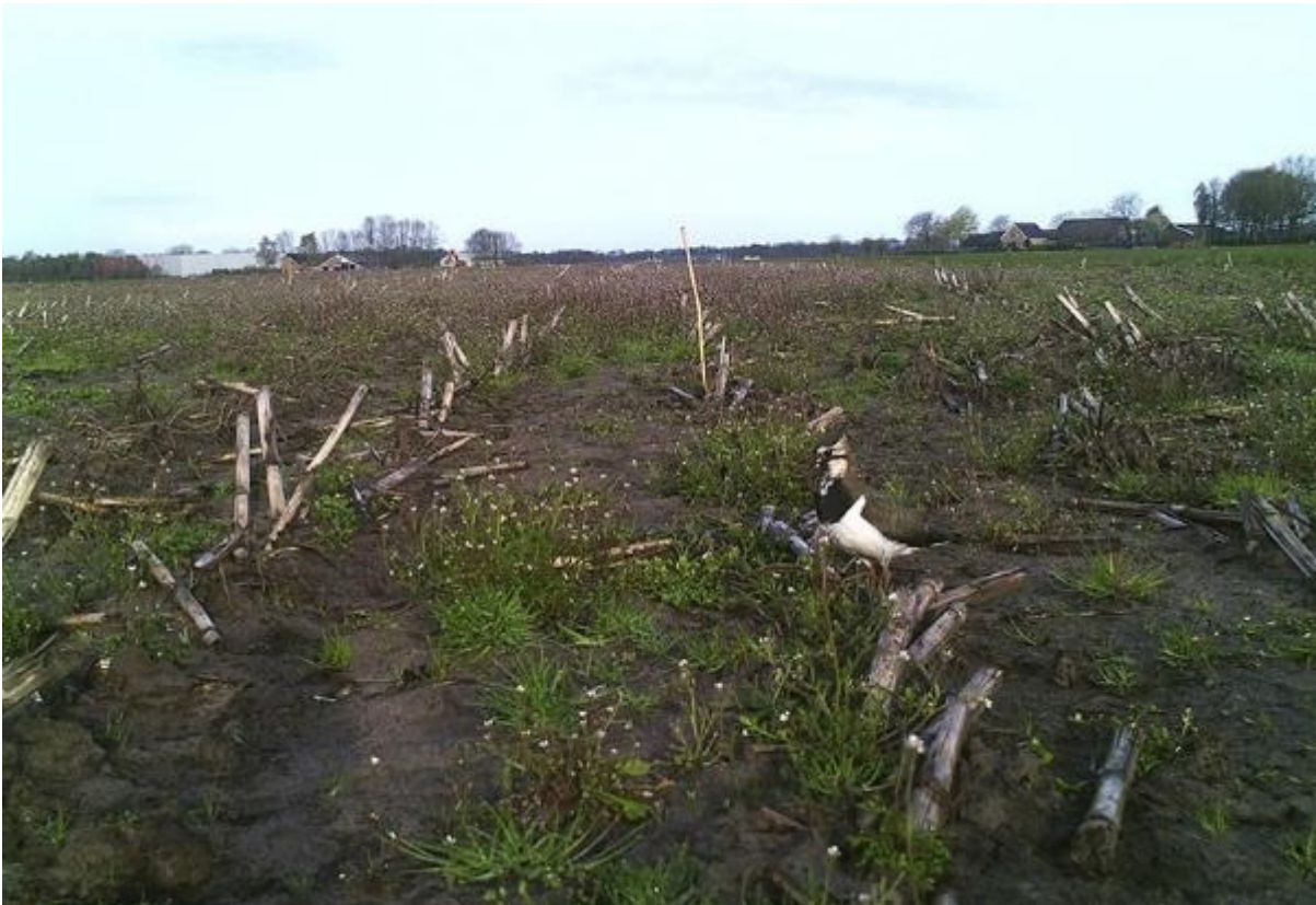
Kievit op bouwland met uitgesteld zaaien, fragment

Contact met veldmedewerkers en/of vrijwilligers is erg belangrijk. Zij brengen de nesten en kuikens in kaart, waarbij zoveel mogelijk vanaf de rand van het perceel gemonitord wordt. Nesten worden geregistreerd, het liefst digitaal. Nesten worden beschermd tegen verstoring via verplaatsen, nestbeschermers of via uitstellen van zaaien van het gewas.