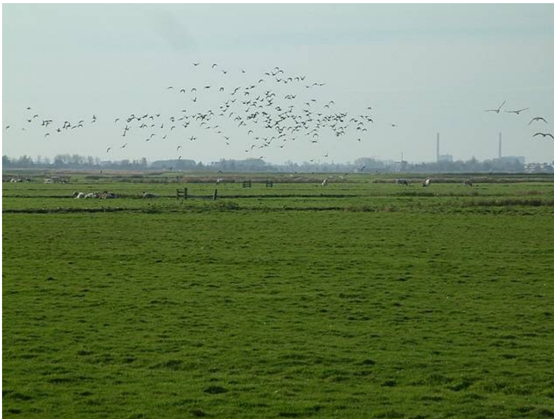
Weidevogellandschap ( https://nl.wikipedia.org/wiki/Weidevogel )

Om te voorkomen dat het gras te zwaar wordt, wordt afgeraden om voor de rustperiode te bemesten. Dat voorkomt dat het gras aan het eind van de rustperiode gaat liggen en vervilt. Dat geldt zeker voor bemesting met kunstmest en drijfmest, waaruit de voedingsstoffen snel beschikbaar komen.