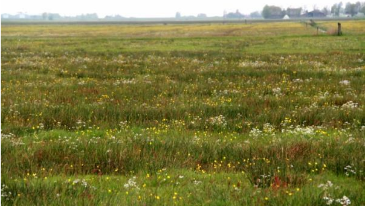
Kruidenrijk grasland

Op kruidenrijke graslanden komen de kruiden van nature in grotere aantallen voor en zijn verspreid over het hele perceel. De zode is open en divers van structuur door de vele kruiden met veel bloei-stengels en weinig blad. Dit heeft ook als voordeel dat kuikens zich goed kunnen voortbewegen in het grasland.