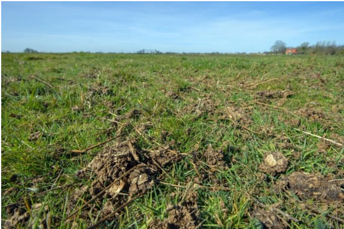
Ruige mest

Dit pakket is specifiek bedoeld voor boerenlandvogelbeheer en kan alleen in combinatie met andere, op broedvogels gerichte pakketten worden afgesloten. In pakketten t.b.v. bodemkwaliteit, water en klimaat is bemesting met ruige mest of andere bodemverbeteraars en plantenresten mogelijk via het pakket Bodemverbetering (pakket 39).